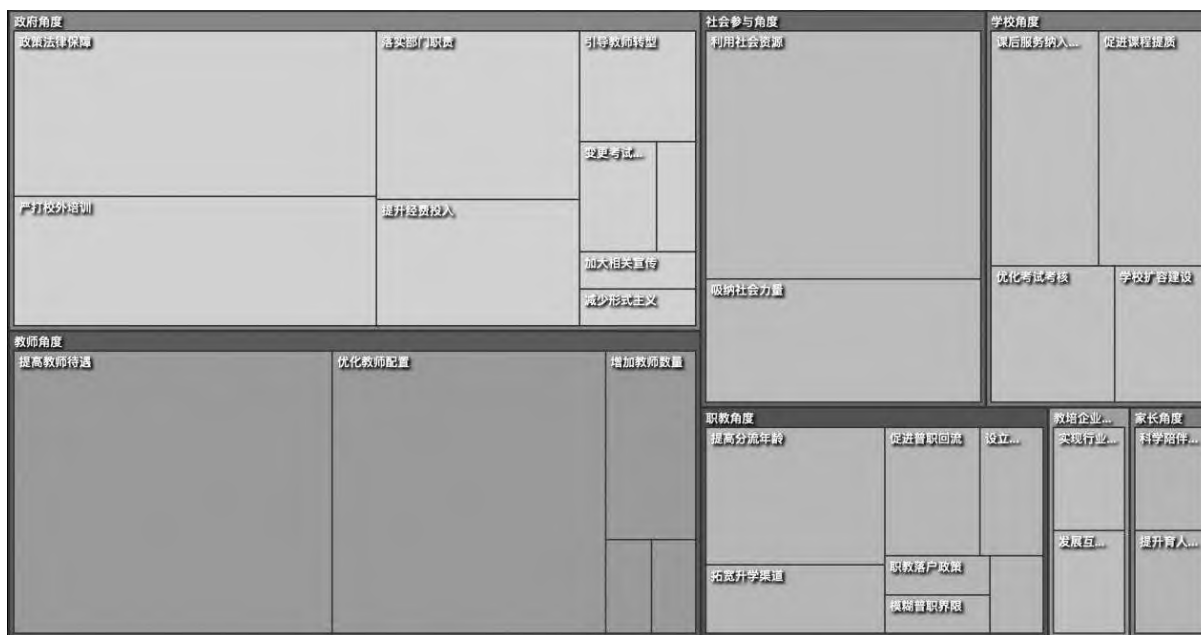
图1 主范畴、子范畴矩形树图