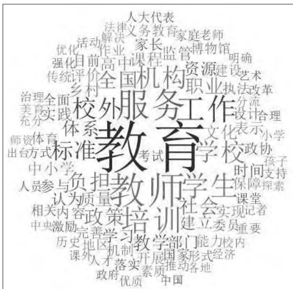
图2 “双减”相关提案、议案词云图

的成效。从教培企业角度，代表委员建议，除了积极转型发展互联网教培，将服务和监管有机结合之外，还要逐步实现行业自律，发挥行业协会带头作用，强化自我管理，主动承担社会责任。